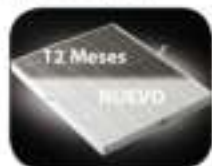
Filtro True HEPA

Los purificadores de aire AeraMax™ llevan incluidos 1 Filtro HEPA y 1 un Filtro de Carbono