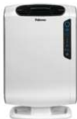
Purificador de Aire AeraMax™ DX55