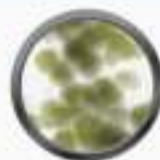
Esporas de Moho