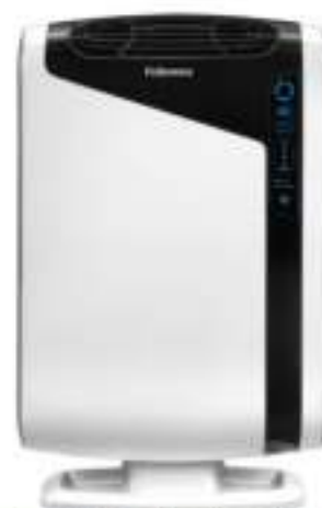
Purificador de Aire AeraMax™ DX95