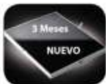
Filtro de Carbono