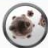
Partículas de polvo