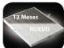
Filtro True HEPA

Los purificadores de aire AeraMax™ llevan incluidos 1 Filtro HEPA y 1 un Filtro de Carbono