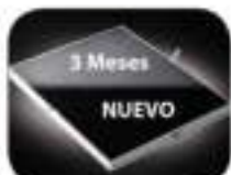
Filtro de Carbono