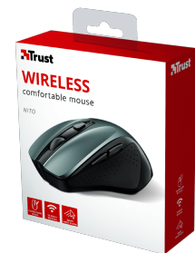
PACKAGE VISUAL 1