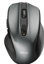
PRODUCT TOP 1