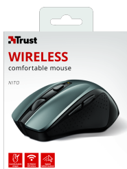
PACKAGE FRONT 1