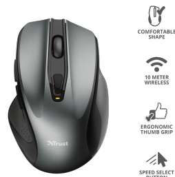
PRODUCT ESHOT 1