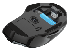
PRODUCT BOTTOM 1