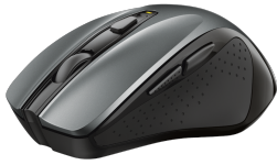
PRODUCT VISUAL 1