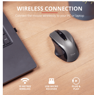
PRODUCT PICTORIAL 1