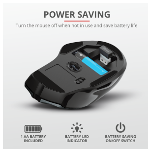
PRODUCT PICTORIAL 3