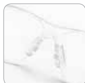
Puente nasal antideslizamiento ajustable