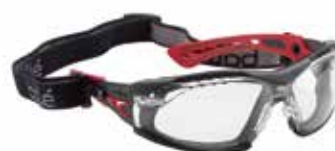
RUSHPFPSI (Rush+ incolora con espuma + cinta elástica)