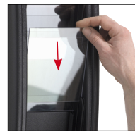
ventanas de insertar