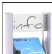
Espacio de Publicidad