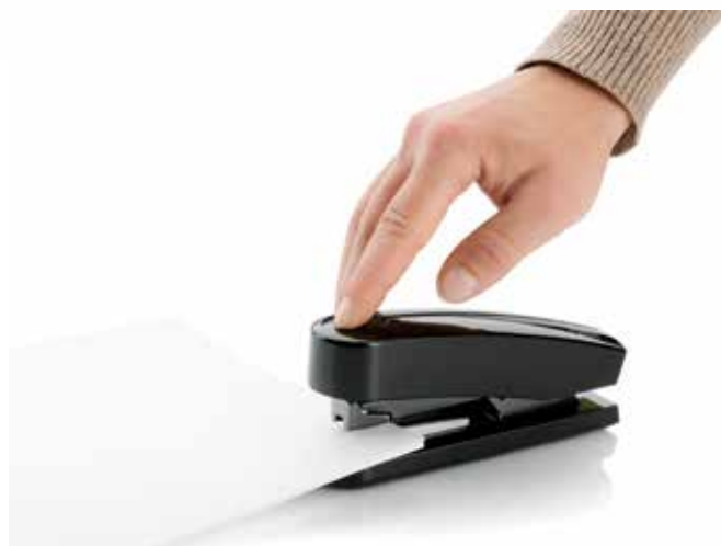
Novus B 4 re+new con pictogramas