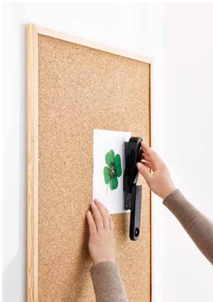
Tipos posibles de grapado:

Presionando el botón que lleva la grapadora en la parte trasera, el cargador sale automáticamente por delante y permite introducir la nueva carga de grapas..