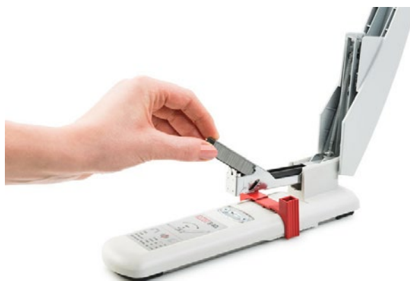
El mecanismo de carga superior permite introducir las grapas en el dispositivo tras levantar la parte superior.