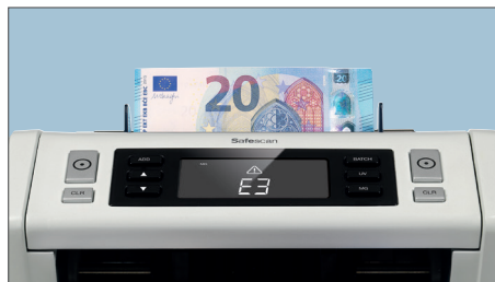
3 FORMAS DE DETECCIÓN DE BILLETES FALSOS: UV, MG Y IR