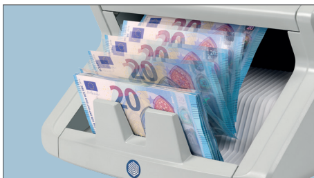
VELOCIDAD CONTADORA DE 1.000 BILLETES/MINUTO