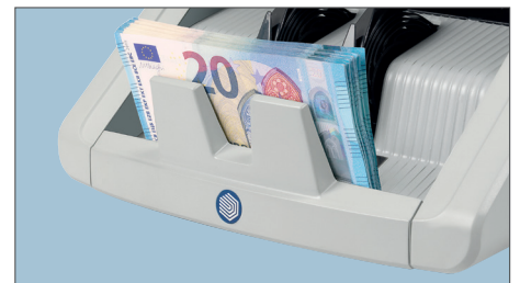
FUNCIÓN DE LOTE AJUSTABLE PARA CREAR FAJOS DE BILLETES IGUALES