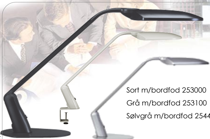
Sort m/bordfod 253000 Grå m/bordfod 253100 Sølvgrå m/bordfod 254400