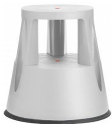
Farbe: 6000-9 RAL 7035