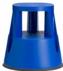
Farve: 6000-5 RAL 5005