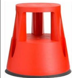
Farbe: 6000-4 RAL 3020