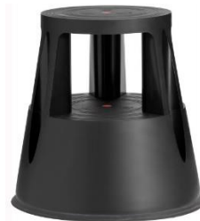
Farbe: 6000-1 RAL 9005