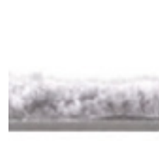
Gesamthöhe 8,5 mm