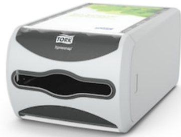
Tork XPN Counter NapDisp, Grey (N4) 272513