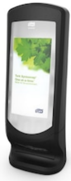
Tork XPN Stand NapDisp, Black (N4) 272211