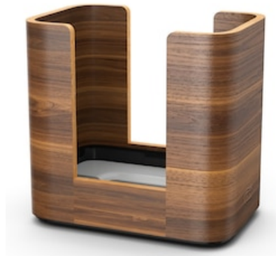
Tork XPN NapDisp, Walnut (N4) 273002