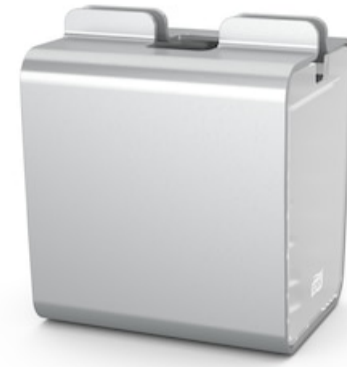
Tork XPN NapDisp, Aluminium (N4) 274002