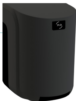
REF 8 99 1383 Cleanline Maxi-Trommel, schwarz LE 1 : 6