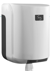
REF 8 99 605 Cleanline Maxi-Trommel Abdeckung weiß LE 1 : 6