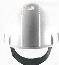
Zeigt an, wann der Helm ausgetauscht werden muss.