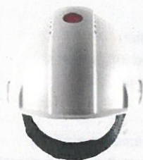
Misst die UV-Strahlungsexposition

Die korrekte Funktion des Uvicator Sensor ist nur dann gewährleistet, wenn die Scheibe frei von Aufklebern, u.ä. Etiketten bleibt.