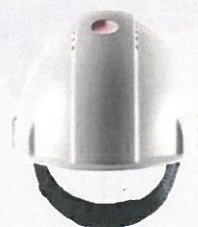
Funktioniert weltweit in den meisten Umgebungen