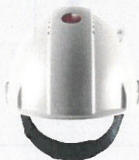
Technisch kalibriert und getestet