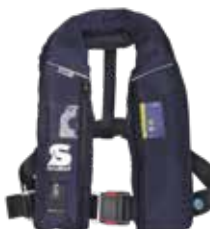
**ALPHA 275 SOLAS AS (Artikelnummer: 14824-01)