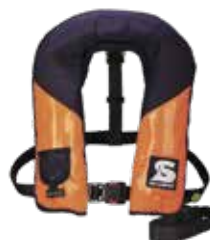
**GOLF 275 AS (Artikelnummer: 13805)

Kompatibel für die Verwendung mit Secumar Rettungswesten* der folgenden Modelle**: