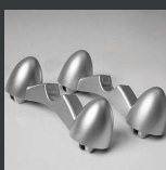
Standgerät mit der rollen