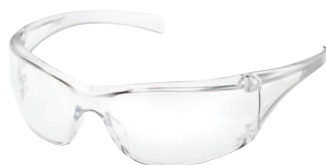
71512-00000M 3M™ Virtua™ AP (klare Scheibe)