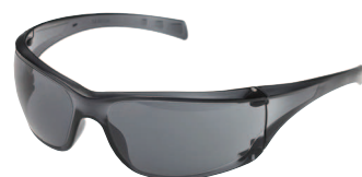
71512-00001M 3M™ Virtua™ AP (graue Scheibe)