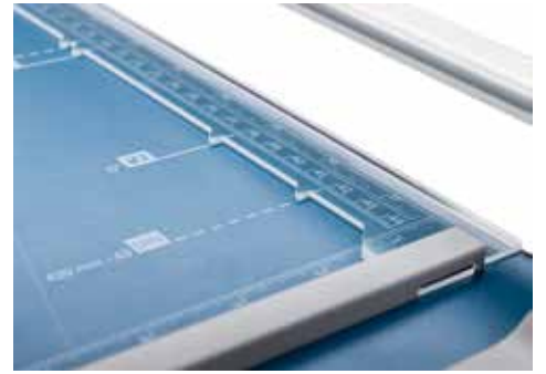
Dahle Schneidemaschinen 508 (Generation 3)