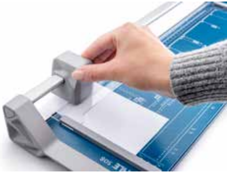
Dahle Schneidemaschinen 508 (Generation 3)