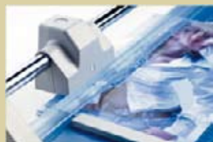
Automatische Pressung an der Schnittstelle