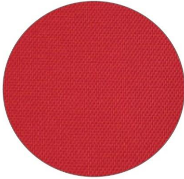
2. Rojo / Red