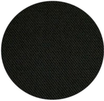
4. Negro / Black