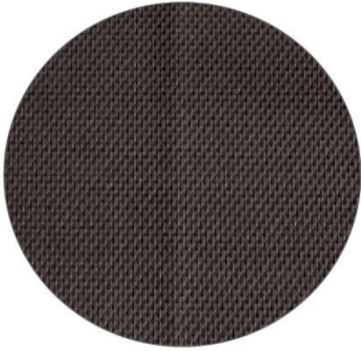
1. Gris / Grey