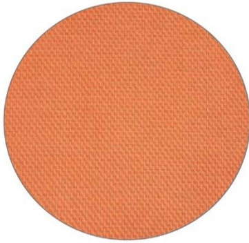
5. Naranja / Orange