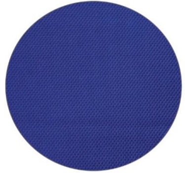
3. Azul / Blue