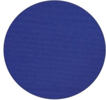
3. Azul / Blue