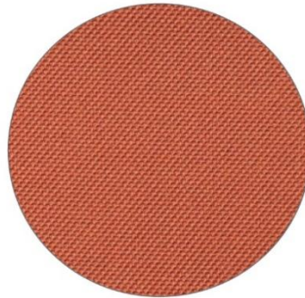
5. Naranja / Orange