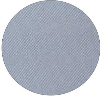
1. Gris / Grey