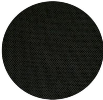
4. Negro / Black