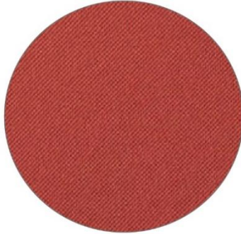
2. Rojo / Red