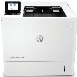
HP LaserJet Enterprise M608dn