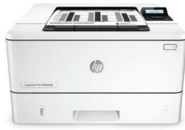
HP LaserJet Pro M402dn

Tulostussuorituskykyä ja tehokasta tietoturvaa työtapoihisi sopien. Tämä suorituskykyinen tulostin tulostaa työt nopeammin ja suojaa kattavasti tietokonetta uhkia vastaan. Alkuperäiset HP-värikasetit ja JetIntelligence tuottavat enemmän tulosteita. 2