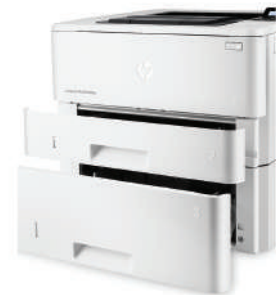
HP LaserJet Pro M402dn valinnaisella 550 arkin alustalla