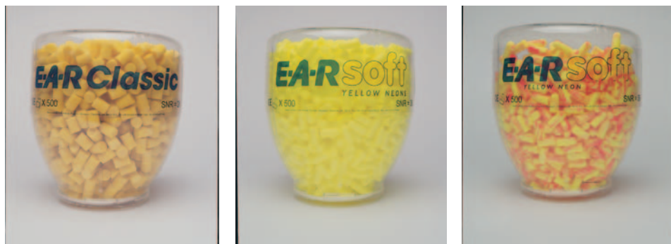
Les différentes recharges de 500 paires pour le One Touch

Les recharges 'One Touch' sont extrêmement faciles à changer. Il suffit de suivre les 4 étapes ci dessous. Quand le 'One Touch' est vide, il suffit de changer la bouteille. Le support bleu ainsi que l'entonnoir peuvent être utilisés autant de fois que nécessaires.