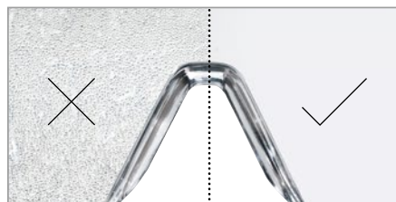
Avec technologie uvex supravision éprouvée ou sans traitement, mais toujours avec protection UV400