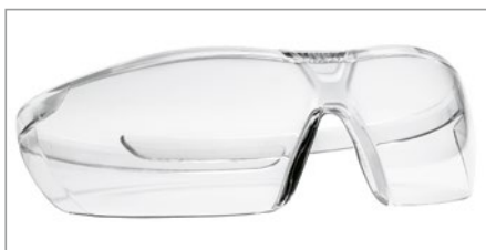
Design de l'oculaire sans monture innovant pour une visibilité parfaite et dégagée

Non seulement innovantes, mais aussi confortables: ces lunettes de protection se caractérisent par leur extrême légèreté. Les branches flexibles s'adaptent parfaitement à toutes les formes de tête et garantissent un maintien sûr. uvex pure-fit existe en deux variantes différentes: sans traitement et, bien sûr, en version avec traitement, avec la technologie de traitement uvex supravision éprouvée.