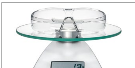
reduced to the max (l'essentiel uniquement) un seul matériau pour des lunettes de protection en polycarbonate ultra-légères de seulement 19 grammes