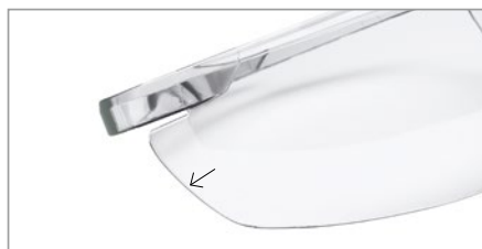
x-tended sideshield pour une protection de la région oculaire latérale