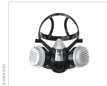
X-plore® 3000 Kit chimie