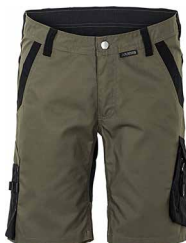
vert olive/noir 6455