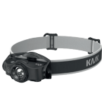
WLA00001/2/3 LAMPE FRONTALE