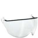
VWV00018 VISIÈRE V2 PLUS