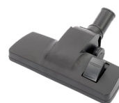
Suceur sols mixte