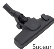
Suceur sols mixte ECO