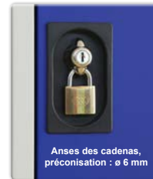
Anses des cadenas, préconisation : ø 6 mm

Casier Visitable avec morillon porte cadenas + clé passe