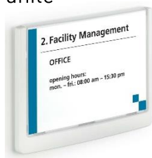
Réf. 4861 149 x 105,5 mm (LxH)