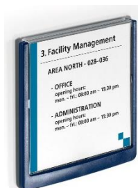
Réf. 4862 149 x 148,5 mm (LxH)