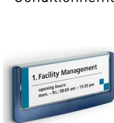
Réf. 4860 149 x 52,5 mm (LxH)

Réf. 4860, 4861, 4862, 4866, 4867 Coloris : graphite (37), bleu (07), blanc (02) Conditionnement : à l'unité