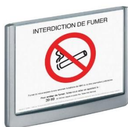
Réf. 4866 149 x 210,5 mm (LxH)