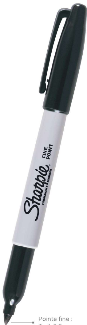
Pointe fine : Trait 0.9 mm