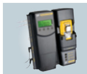
Station d'accueil MicroDock II