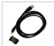
Kit de connexion infrarouge