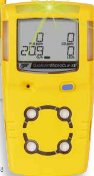
GasAlert MicroClip XL

NOUVEAU ! Les détecteurs GasAlertMicroClip X3 et GasAlertMicroClip XL offrent désormais un degré de protection IP68 pour une protection maximale contre l'eau et la poussière (jusqu'à 45 minutes à 1,2 m de profondeur).