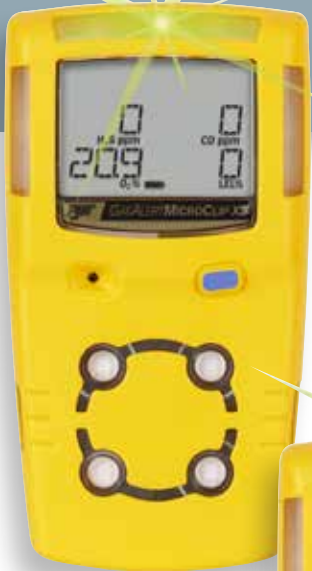
GasAlert MicroClip X3

Garanti pour fonctionner pendant un poste entier (même par temps difficile).