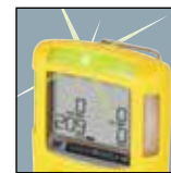
Simplicité de visualisation

Utilisez notre technologie avancée unique pour garantir sécurité, conformité et productivité.