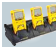
Chargeur socle cinq unités

Pour obtenir la liste complète des kits et accessoires, veuillez contacter BW Technologies by Honeywell.