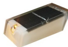
Opción : LED