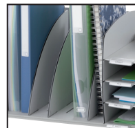
Séparateurs amovibles réglables tous les 2.3 cm