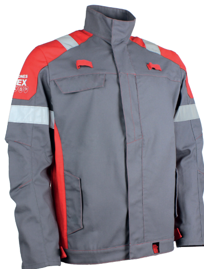
Gris Acier/Rouge 20R