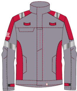
AET n°033/2022/0000 Valable jusqu'au 00/00/2027

Nous déclarons que les Equipements de Protection Individuelle neufs suivants :