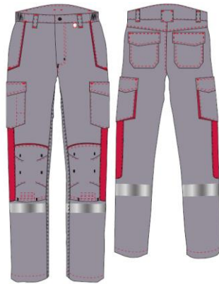
AET n°033/2022/0000 Valable jusqu'au 00/00/2027

Avec protection genoux AET n°033/2022/0000 Valable jusqu'au 00/00/2027