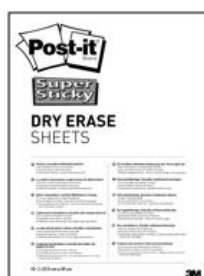
DEFPack-EU – 15 Pack – 27,9 cm x 39,0 cm