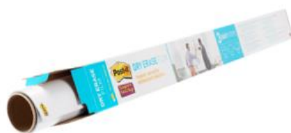
DEF3x2-EU DEF4x3-EU DEF6x4-EU DEF8x4-EU