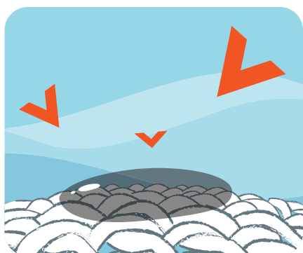
Les enzymes attaquent la tache pour la décomposer en microparticules.

Une technologie supérieure et des ingrédients hautement performants qui offrent une élimination exceptionnelle des taches tenaces rencontrées quotidiennement en milieux professionnels.