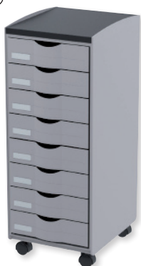
DT081N.01.02 gris plateau noir