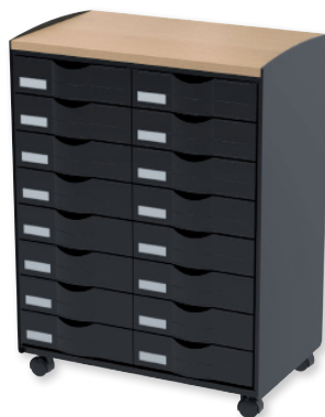
DT161N.01.23 noir plateau hêtre