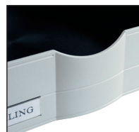
Forme ergonomique pour faciliter la préhension