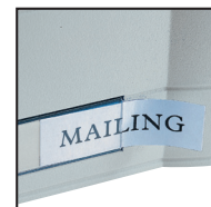
Livré avec porte-étiquettes et étiquettes