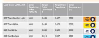
Light colors, color rendering properties and Light Color Coordinates for OSRAM DULUX® - lamps with integrated control gear

1 | Datenansicht | DRG CODE: Initial Technikbeschreibung: T17000000