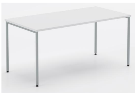
Table de conférence