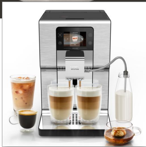
Intuition Experience Hot&Cold, Machine espresso automatique, 36 recettes Machine espresso automatique EA879EE0