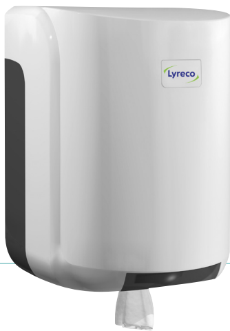
REF 8 99 605 L07 Cleanline Dévidoir maxi capot blanc UL 1 : 6