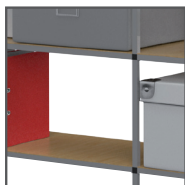
Plateaux Isorel fournis