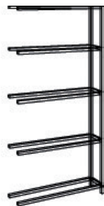
Elément départ + Elément suivant