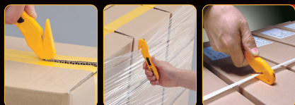
Guide latéral métal