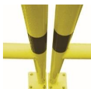
Offset fixing plate