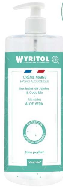
Sans parfum Microbilles Aloe Vera