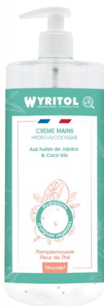
Pamplemousse Fleur de Thé