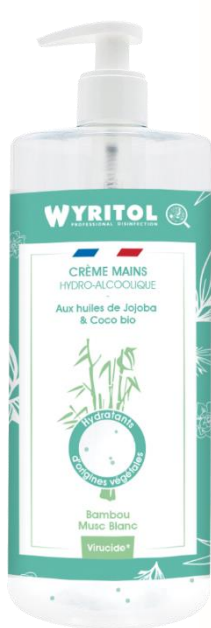
Bambou Musc Blanc